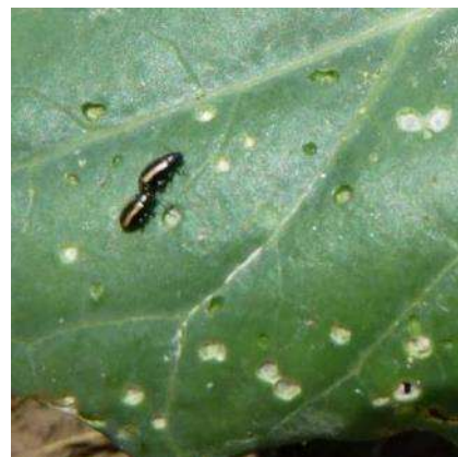
Altises sur chou.

Au printemps de l'année suivante, il reprend son activité et se reproduit. Les œufs sont déposés isolément sur le sol, au voisinage du collet des crucifères. L'évolution embryonnaire dure une dizaine de jours. La larve pénètre à l'intérieur du végétal où elle grossit avant de se nymphoser dans le sol.