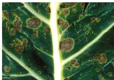
Taches de Mycosphaerella