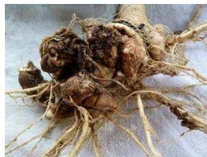
Hernie des crucifères

Le champignon se conserve longtemps (jusqu'à 10 ans sans crucifères dans la rotation). La maladie se développe entre 6 et 35°C avec un optimum thermique de 20-25°C, c'est donc une maladie essentiellement estivale.