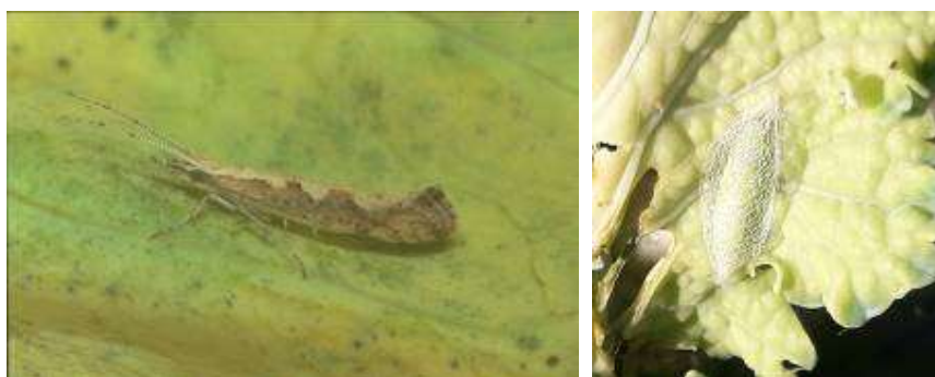
Teigne des crucifères : de gauche à droite : Adulte ; Chrysalide

Remarque : Ces dernières années, on n'a pas relevé, sur choux, de dégâts liés aux noctuelles terricoles : "vers gris" (Agrotis segetum, A. ypsilon...) qui, de fin juin à début août, peuvent couper au ras du sol les jeunes plants durant la nuit (la larve restant cachée dans le sol durant la journée).