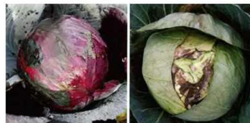
Rhizoctonia sur choux