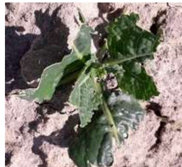
Dégâts d'oiseaux sur choux

Sources des données sur les bioagresseurs : Ephytia, Guide de protection des cultures Chambre d'agriculture de Bretagne, Productions légumières Tome 2, Chau & Foury, 1994