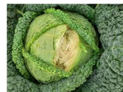
Eclatement de la pomme - photo - CA31

Veillez à éviter les à-coups d'eau et les excès d'eau , pouvant aboutir à un éclatement des pommes. Des dégâts peuvent notamment avoir lieu lors de fortes précipitations.