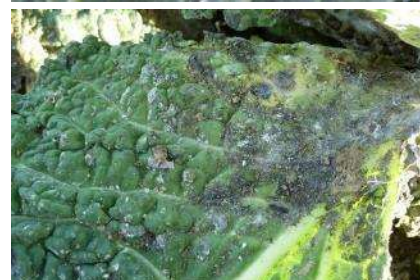
Aleurodes sur choux, développement de fumagine

Techniques alternatives : Sous réserve de pouvoir atteindre le dessous des feuilles lors de l'application, il est possible de recourir à un produit de biocontrôle à base d'huile essentielle d'orange qui va réduire les populations (action de contact).