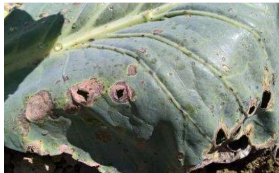
Taches d'Alternaria – Photo CA31

Symptômes : Petites taches sombres de 1 à 3 mm. Elles s'agrandissent assez rapidement et forment des lésions circulaires qui prennent rapidement une teinte brun jaunâtre à noire tandis qu'un halo jaune, assez marqué, les ceinture. Elles sont parfois partiellement angulaires lorsqu'elles sont délimitées par les nervures. Les tissus végétaux altérés situés au centre des taches s'éclaircissent, présentent de temps à autres des "motifs" concentriques. Ils deviennent minces, parcheminés et ne tardent pas à tomber. Les feuilles sont plus ou moins criblées à terme. L'infection démarre par les feuilles plutôt basses et progresse vers la pomme.