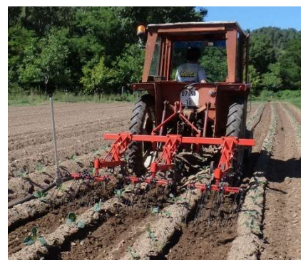
Binage mécanique - Photo CA30

Le goutte à goutte est une pratique qui se développe dans d'autres régions (problématiques liées au vent, qui ne permet pas une irrigation homogène, et à la ressource en eau).