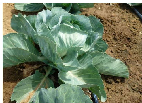
Irrigation au goutte à goutte - Photo CA30

Prophylaxie : Maintenir les parcelles et les abords aussi propres que possibles sur l'ensemble de la rotation.