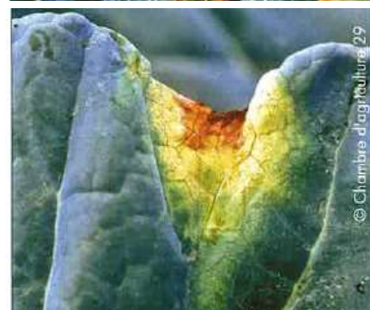
Bactériose bordure de feuille ou en « en V »