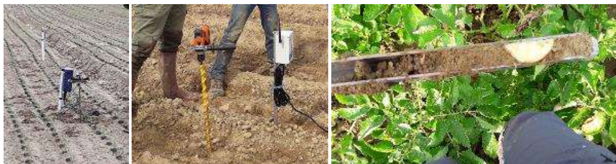
Sondes tensiométriques connectées, sonde capacitive connectée, humidité du sol sur 25 cm à l'aide d'une gouge