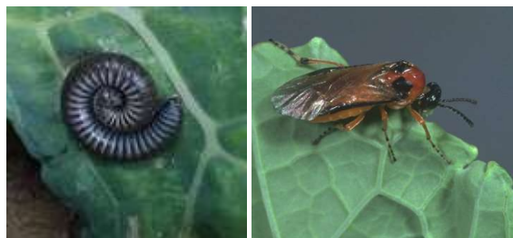
Tenthrede de la rave (larve et adulte)

Les jeunes larves découpent la face inférieure des feuilles ou les trouent (dégâts économiquement insignifiants). Les larves plus âgées rongent les feuilles à partir de la face inférieure et du bord, ne laissant subsister que les nervures ; la défoliation est très rapide. En cas de pullulation, une défoliation complète peut avoir lieu.