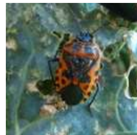
Punaise du chou

Ces punaises se nourrissent en piquant le limbe des feuilles et en ponctionnant les liquides cellulaires. Des piqûres en très grand nombre provoquent le jaunissement complet des feuilles. Les jeunes plantes fortement attaquées peuvent mourir.