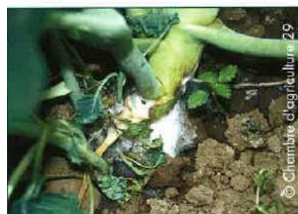
Sclérotinia sur collet de brocolis

Conditions favorables à son développement : Cette maladie se développe à des températures comprises entre 2 et 30°C (optimal thermique légèrement en-dessous de 20°C). Elle est favorisée par les périodes humides et pluvieuses. Les sclérotés peuvent se conserver dans le sol et les débris végétaux pendant de nombreuses années. Les