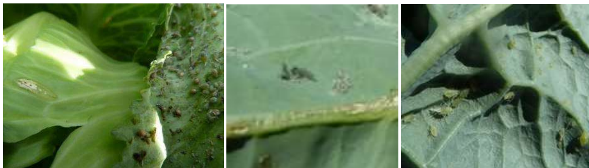
Pucerons et larve de syrphe, pucerons cendrés, pucerons verts - Photos CA 31.

En automne, apparaissent les individus sexués qui s'accoupleront. Les hivers doux permettent la survie des virginipares qui se multiplient dès février et dont la descendance ailée peut occasionner des pullulations précoces.