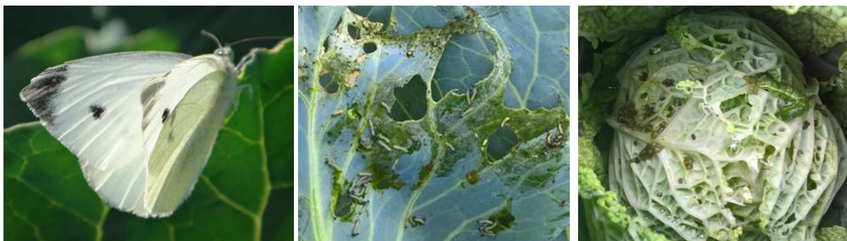
Chenilles phytophages : papillon et larves de piérides, noctuelle - Photos CA 30 et 31.