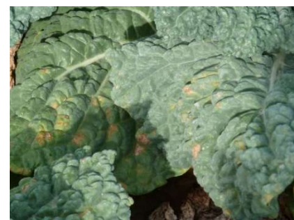
Taches de mildiou sèches - Photo CA31