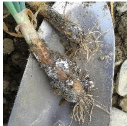
Pourriture blanche

S'il est capable de se développer à des températures comprises entre 4 et 30°C, son optimum thermique se situe sur une plage de température de 17 à 20°C. Il est favorisé par les périodes humides et pluvieuses et attaque les tissus ayant atteint un développement avancé.