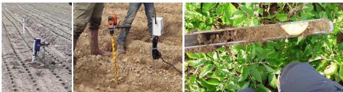
Sondes tensiométriques connectées, sonde capacitive connectée, humidité du sol sur 25 cm à l'aide d'une gouge

* Pour être utilisée sur une culture, les données de l'ETP (Evapo Transpiration Potentielle) doivent être corrigées par un coefficient de rationnement qui tient compte de la culture et de son stade végétatif.