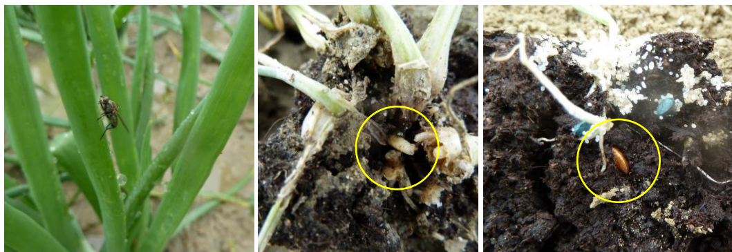
Mouche de l'oignon : adulte, larves, pupes - Photos CA 31