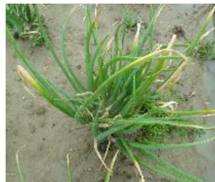
Botrytis squamosa - Photos CA 31

Conditions favorables à son développement : L'infection est favorisée par des périodes très humides et plutôt fraîches (températures avoisinant les 18°C avec un optimum de germination vers 14°C).