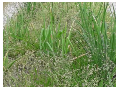
Envahissement par les adventices

Les maraîchers qui travaillent sur de plus petites surfaces s'orientent parfois vers le paillage plastique biodégradable, technique majoritairement choisie par ceux qui sont en AB (Agriculture Biologique).