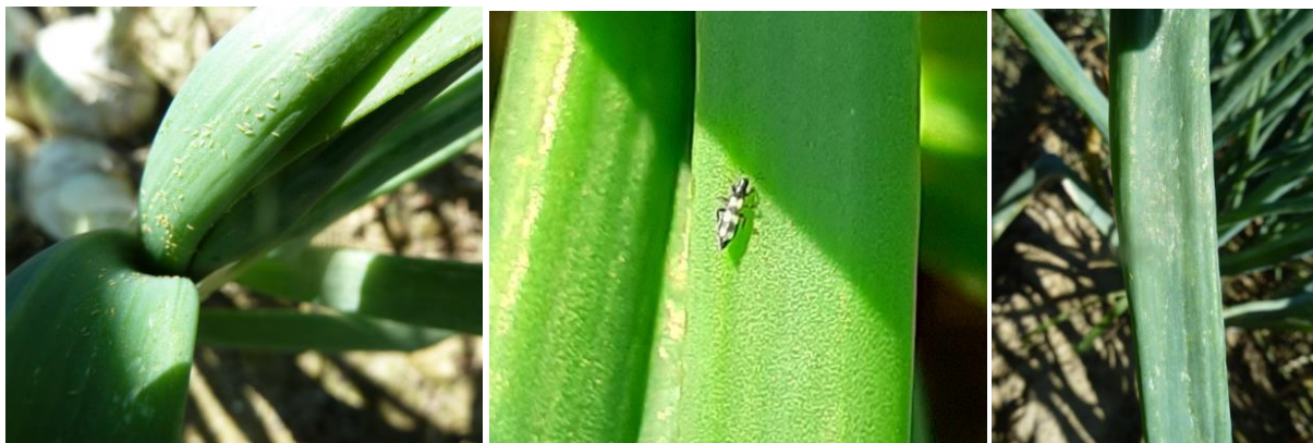
Thrips : larves, larves et Aeolothrips intermedius , dégâts - Photos CA 31

Biologie : L'hivernation se fait sous forme adulte et larvaire dans divers abris (débris végétaux, charpentes d'abris, sol, cultures de plein champ, allium sauvage ...). Des conditions climatiques hivernales défavorables au bon développement des thrips entraînent ainsi de faibles périodes de vol entre mai et juin. La période des vols intensifs commence fin juillet et peut durer