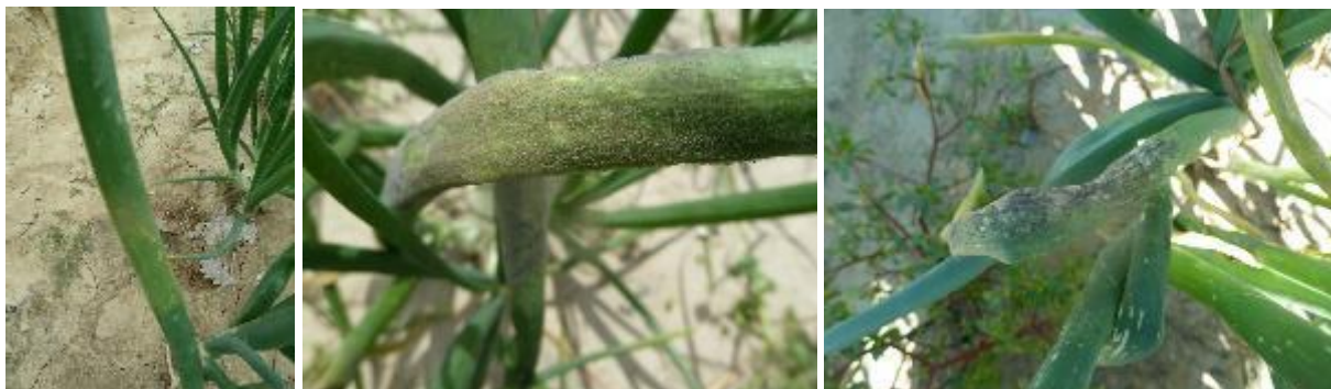
Mildiou : halo jaune, duvet gris violacé, dessèchement