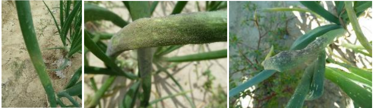
Mildiou : halo jaune, duvet gris violacé, dessèchement